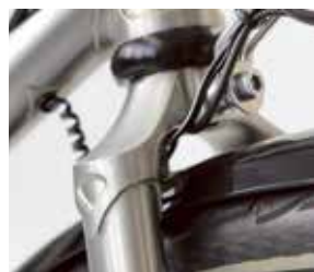
Stabiles Schmuckstück: Der massive Gabelkopf aus Edelstahl.