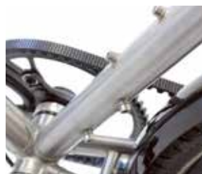
Gewindeösen am Sattelrohr für eine schwerpunkt günstige Aufnahme von Trinkflaschen oder Ausrüstung.